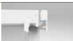
MONTAGGIO A PRESSIONE