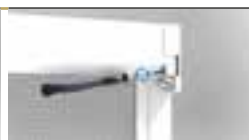
CARICO E SCARICO MOLLA