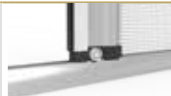
ROTELLA DI SCORRIMENTO

La guida a pavimento è alta solo 2 cm, inoltre il profilo è completamente arrotondato così da essere calpestabile. Fornita sempre Argento OSS