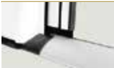
GUIDA RIBASSATA DI 2 CM